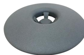
Изглед в профил